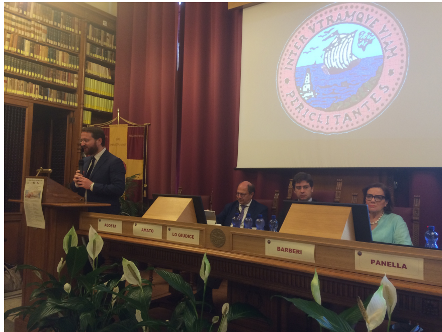
Tavolo dei lavori alla giornata di prolusione al corso

Il 19 Giugno 2019, all'Accademia Peloritana dei Pericolanti presso l'Università degli studi di Messina, si è aperta l'odierna edizione del convegno sul Diritto Penale Minorile organizzata dall'Ass.Pe.93-Camera Minorile, di concerto con l'Ordine degli Avvocati di